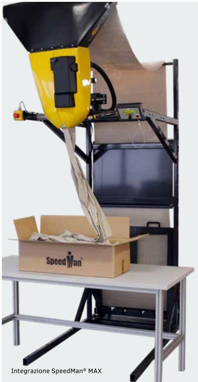
Integrazione SpeedMan® MAX