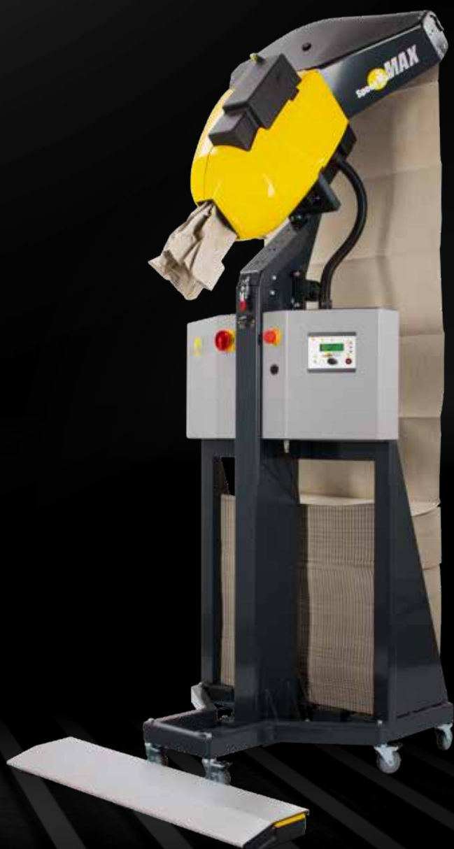
SpeedMan® MAX con telaio per carta impilabile ComPackt®

Phone nr +39 0371 79478 info@sofair.it www.sofair.it